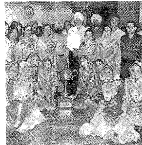
बीबीके डीएवी इंटर...पेज 6